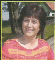
Avtor: Nerina Darman

Zemlja ima vgrajene naravne atmosferske in geomagnetne mehanizme, ki ustvarjajo življenje podpirajoče geo impulze, ti pa ugodno vplivajo na krmiljenje vitalnih življenjskih procesov, vodenih iz človekovih možganov. Planetarni kozmični računalnik za brezžično intuitivno komunikacijo med živimi bitji, z naravo, med posameznimi celicami in organi ter za uglasitev s planetom uporablja osemherčni Schumannov medij.